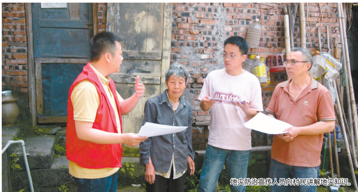
地灾防治宣传人员向村民讲解地灾知识。

本报讯(记者 陈纬 刘强 摄影报道)入汛以来,我市降雨天气增多,地质灾害进入易发、高发、多发窗口期。全市严格落实地灾防治“三查”“三避让”等刚性要求,强化监测预警与隐患排查,多措并举织密防护网,全力保障人民群众生命财产安全。