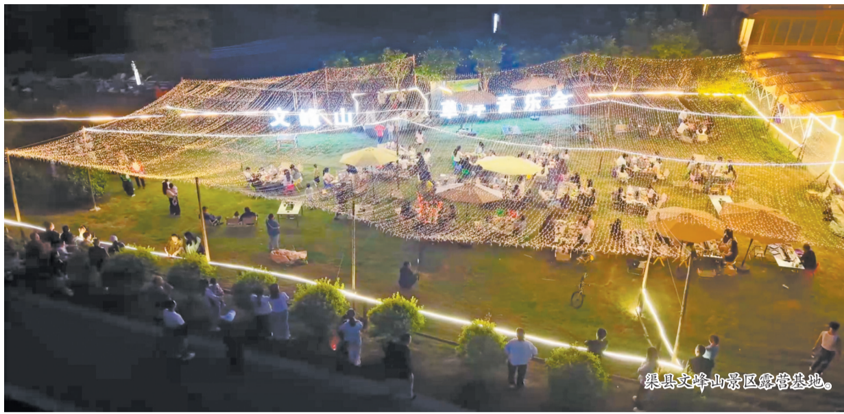
渠县文峰山景区露营基地。

本报讯(记者 何龙 李彦达 胡杨 摄影报道)暑气渐浓,市民就近休闲、轻享时光的需求持续升温,我市近郊休闲市场迎来消费旺季。乡村小院、山野露营等多元业态迭代升级,将自然景致与特色体验深度融合,既为市民打造了放松身心的好去处,也让近郊休闲消费焕发蓬勃生机,成为激活文旅消费的新引擎。