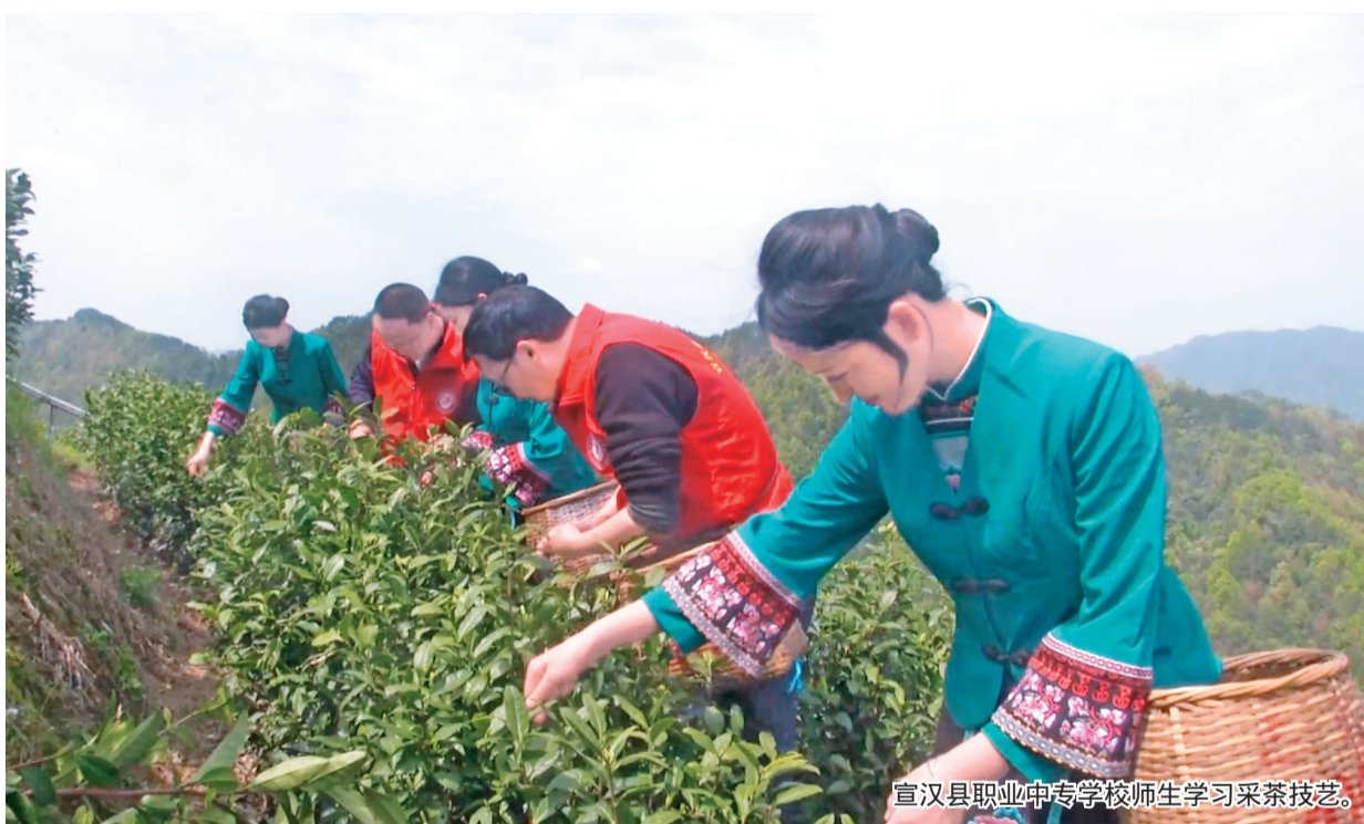
宣汉县职业中专学校师生学习采茶技艺。

各地铁路部门精心组织清明假期运输,落实便民利民惠民举措,全力保障旅客平安有序温馨出行,为假日经济平稳运行提供运输支撑。国铁郑州局集团公司开行郑州东至洛阳龙门赏花列车,为旅客前往洛阳观赏牡丹提供便利。国铁武汉局集团公司开行汉口至麻城方向的踏青赏花专列,方便旅客前往大别山观赏杜鹃。国铁南宁局集团公司开行前往新疆方向旅游列车,让旅客一路饱览海上魔鬼城、赛里木湖、火焰山等大美风光。国铁成都局集团公司开行“熊猫专列·安逸号”和“锦绣山河·岷江号”旅游列车,串联九寨沟、峨眉山、乐山大佛、都江堰等著名景点,为旅客春游提供丰富选择。