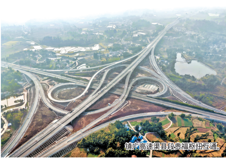
镇广高速渠县段贵福枢纽互通。

绍,该服务区计划打造为开放式服务区,创新设置柑橘产业园直达通道,游客可随时进入园区现场采摘购买新鲜柑橘。