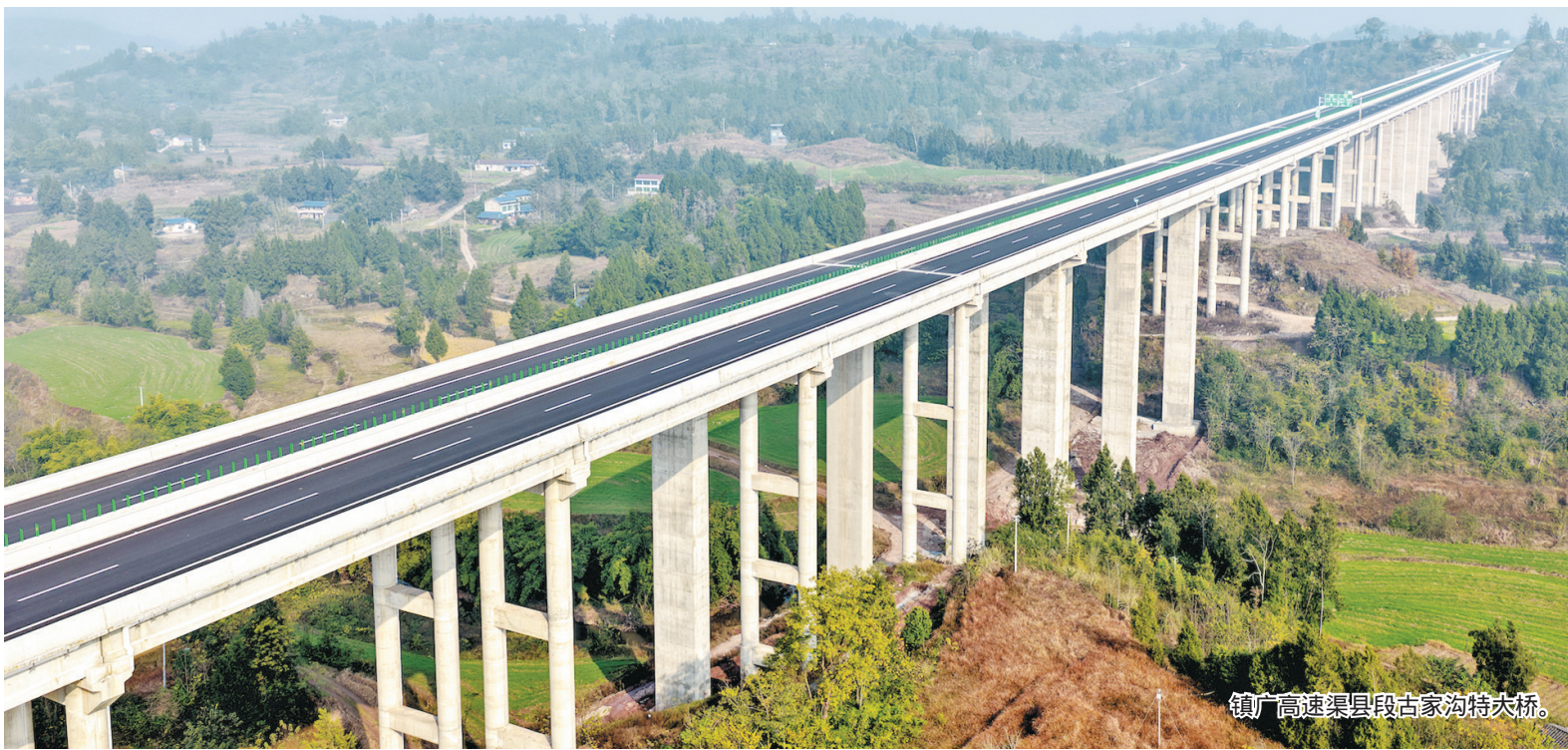
镇广高速渠县段古家沟特大桥。