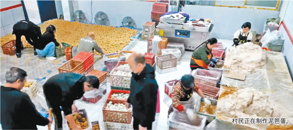
村民正在制作泥笆蛋。

本报讯(记者 田蓉 摄影报道)一枚普通的鸭蛋,裹上渠县特有的红泥,经过省级非物质文化遗产的精心制作,便能“蜕变”为风味独特、市场走俏的泥笆蛋。如今在渠县,这项传承已久的技艺正焕发新生机,年产超千万枚的泥笆蛋,成功构建起一条惠及乡里的完整产业链,让当地村民实现了“挣钱顾家两不误”的愿望。